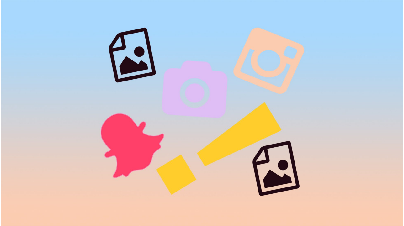
Bild som medel för att övertyga

Lektionen handlar om bild som medel för att påverka och övertyga.