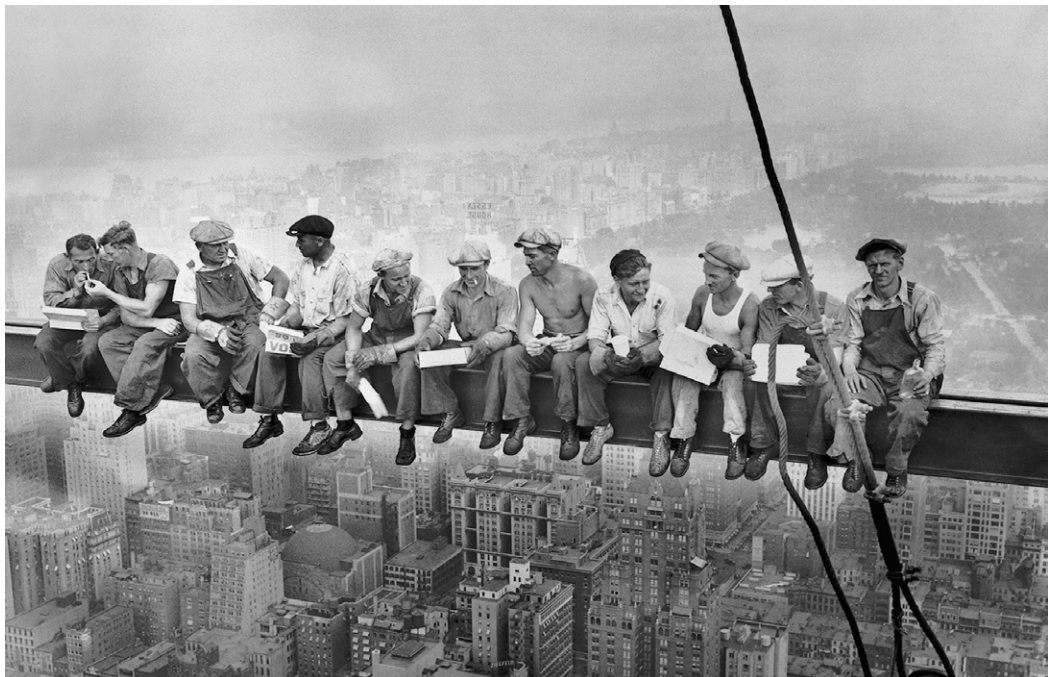
Av Charles Clyde Ebbets 3 , Public Domain