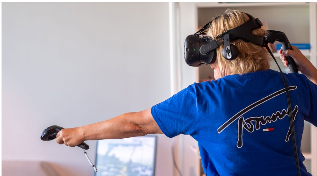
En person spelar med VR (virtual reality)