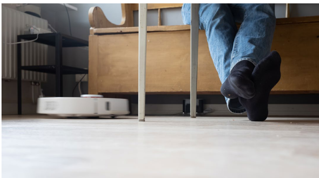
En kökssoffa med en persons fötter på golvet tillsammans med en robotdammsugare.