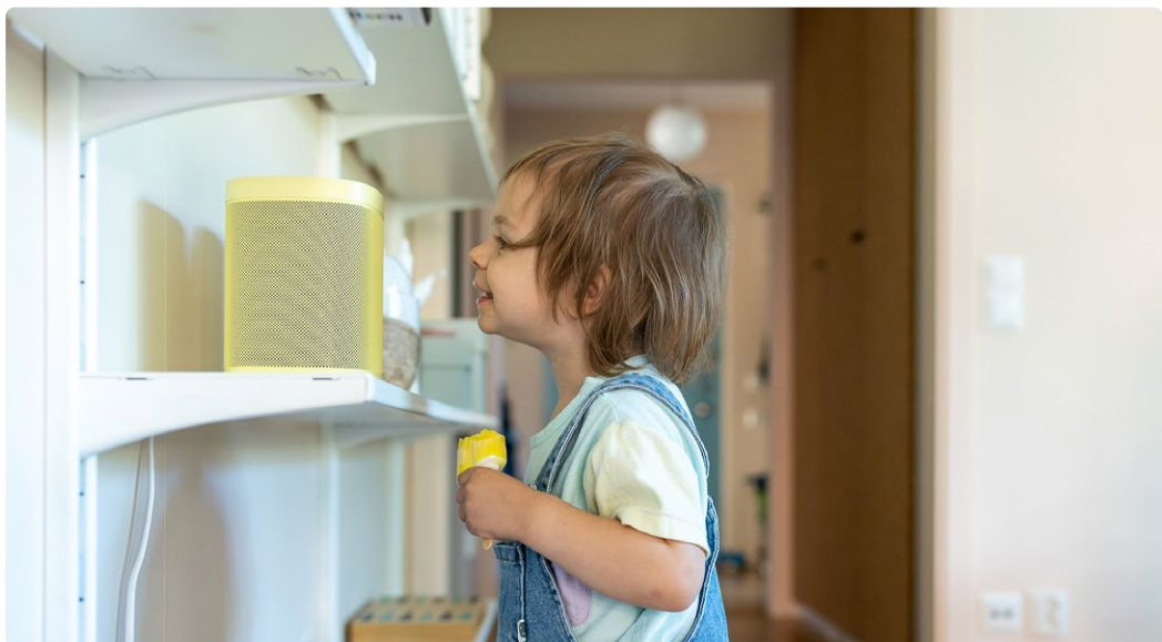
Barn med "smart" högtalare.

Titta på bilderna. Alla föremål på bilderna bygger på digital teknik. De kan vara uppkopplade mot internet.