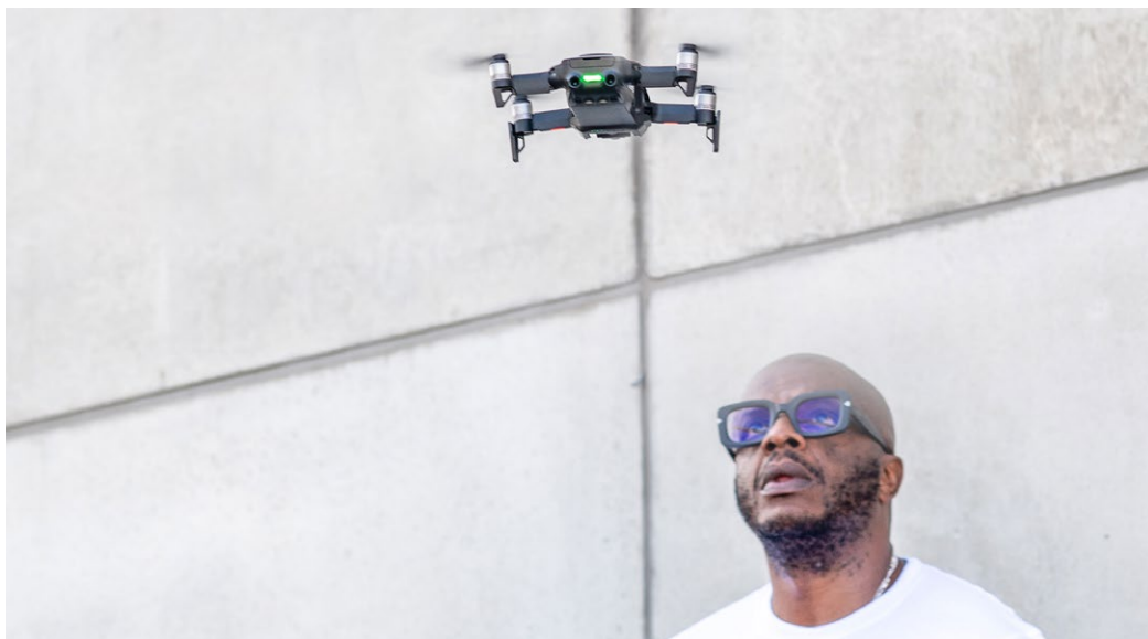
En man tittar på en flygande drönare.